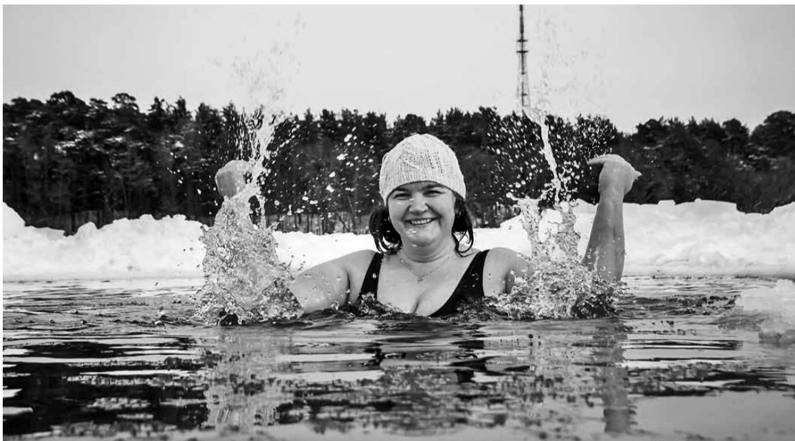
Jääaugun ojumine om tore vaheldus.

tāpsussõit jne. MM-il läits mul oma arust āste. Bussijuhte olli kokku 37 ja mia olli 11.