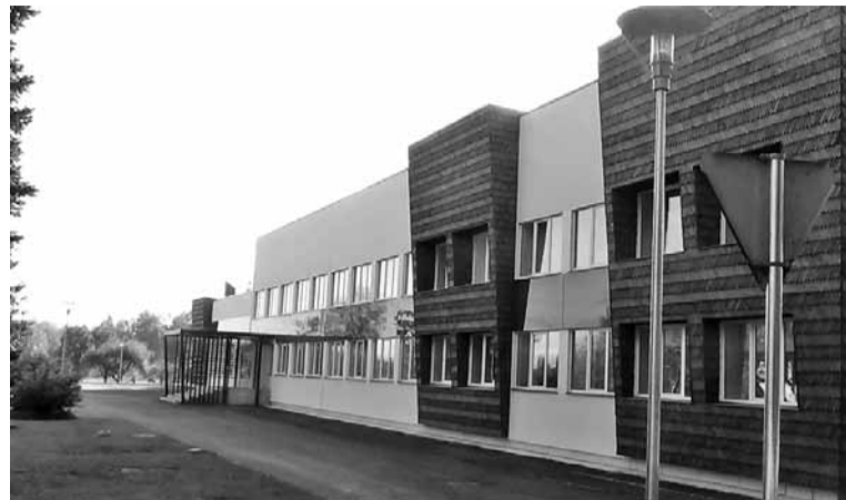
Polli aiandusuuringide keskuse päämaja Pollin.

Ettevõtjadel ja täädlastel olli uvi kah tuutmisest üle jäänu ja mudu ärä visatevest kraamist midägi tetä. Sellest sündüsi projekt, mille abige om Pollin käimä pantu Eesti edimene täädmistepöhine tervise- ja luudustoodete kompetentsikeskus, kun om tuuraines taime. Projektin om osalise 23 Eesti ettevõtete ja ühendust, nt A.Le Coq AS, Karksi vald, MK Loodusravi OÜ, Orto AS, Põltsamaa Felix AS, Saarek AS, Vipis OÜ, jpt. Polli om oodet kik asjast uvitet maaülikooli täädlaste ja kuuntüüd tetäs Tartu Ülikooli farmaatsia- ja keemiainstituudi