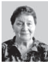
Virve Alt Suistle valla mulk

Enne munapühä akass üits suur koristus ja puhastus joba nädäli keskel. Nelläbe koristedi