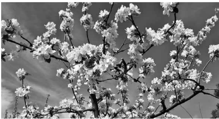
Keväd om Pollin kige ilusamb aig, sis ehive kik aia endit äitsmidege.

Kalju Kase luudu sort. Ubin om keskmise suurusege või suur (ariliguld 100–150 g) ja ümārik, mõne madale kandige. Värm om rohkikas või rohkikasköllane, pääl om tumembet puna. Villäliha om rohkikasvalge, tihe, magusapu maiguge. Korjates septembre