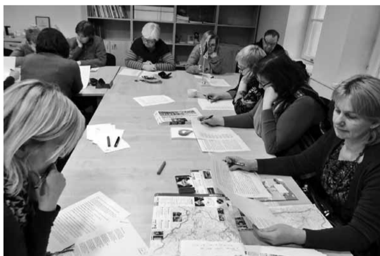
Tõrva murderingin om egä kõrd latsin 10-15 murdeuvilist inimest.

Edimesel ringi kokkukäimise päeval olli ringist osa saade tahtjit nii pallu, et paistse, nigu jääs instituudi ruumi ringi jaos