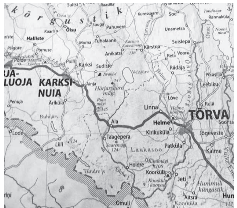
Regio uvve maakaardi pääl om olemen nii Rutu ku Härjassaare mägi.