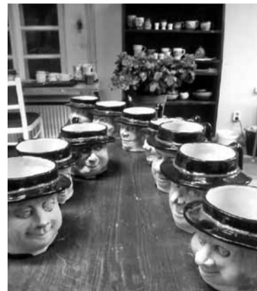
Savist tettu Mulgi mihe Mulgi Savikoaan.

Savikoa nime kohta ütelp perenaine, et Mulgi Savikoda tundusi talle egät pidi paslik. Esmald selleperäst, et savikoda om Mulgimaal ja kah kaugembelt tuleja