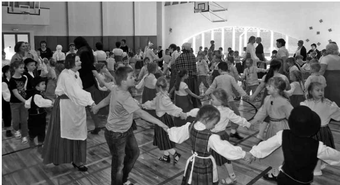
Latse saive Eimtaln volklooripäeväl ütenkuun lusti.